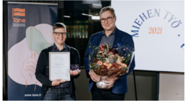
Tasa-arvoasiain neuvottelukunta (Tane) myönsi Mieskaveritoiminnalle Miehen työ 2021 -palkinnon lähes kolmekymmentä vuotta kestäneestä pitkäjänteisestä työstä sukupuolten tasa-arvon eteen.

olevien lasten äideille tehtiin seitsemättä kertaa kysely toiminnasta ja toiminnan merkityksestä. Mieskaveritoiminnan materiaalia ja ohjeita on uudistettu palautteen ja kokemusten pohjalta.